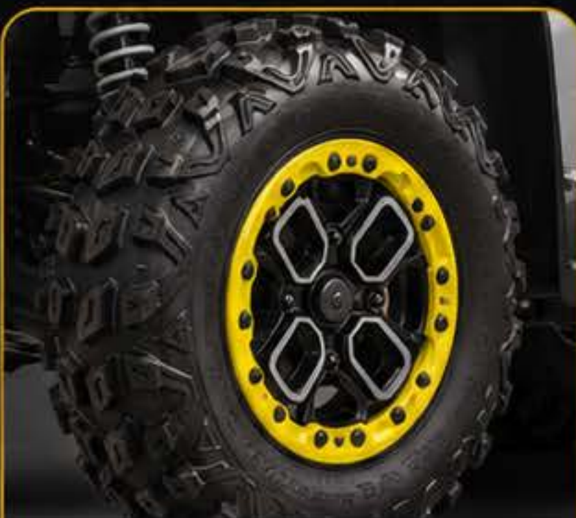
צמיגי 27" וחישוקי 14"