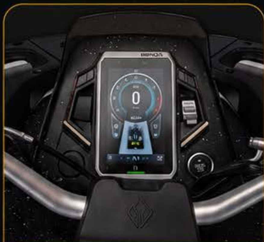
לוח מחוונים דיגיטלי

REDSTONE 1000 R2 משלב בין עיצוב קשוח לבין פרטים חכמים שמקלים על העבודה ועל הרכיבה: בורר מצבי רכיבה, התנעה בלחיצה אחת, לוח מחוונים דיגיטלי, כננת קדמית ותפעול ארגונומי שמרגיש מודרני ומסודר.