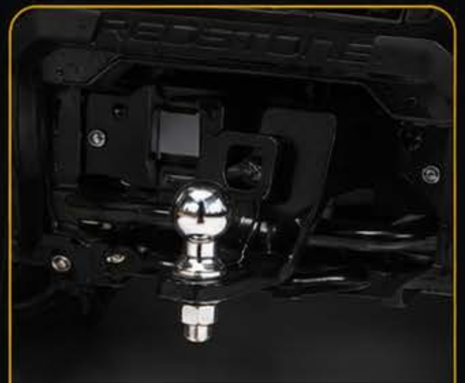
תפוח גרירה אחורי