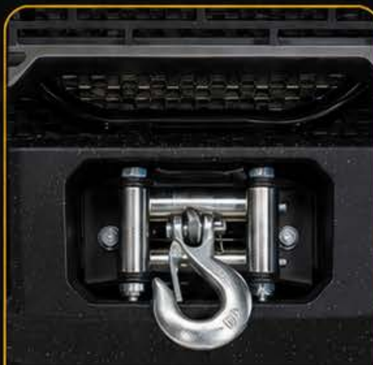
כננת קדמית לשטח ולעבודה