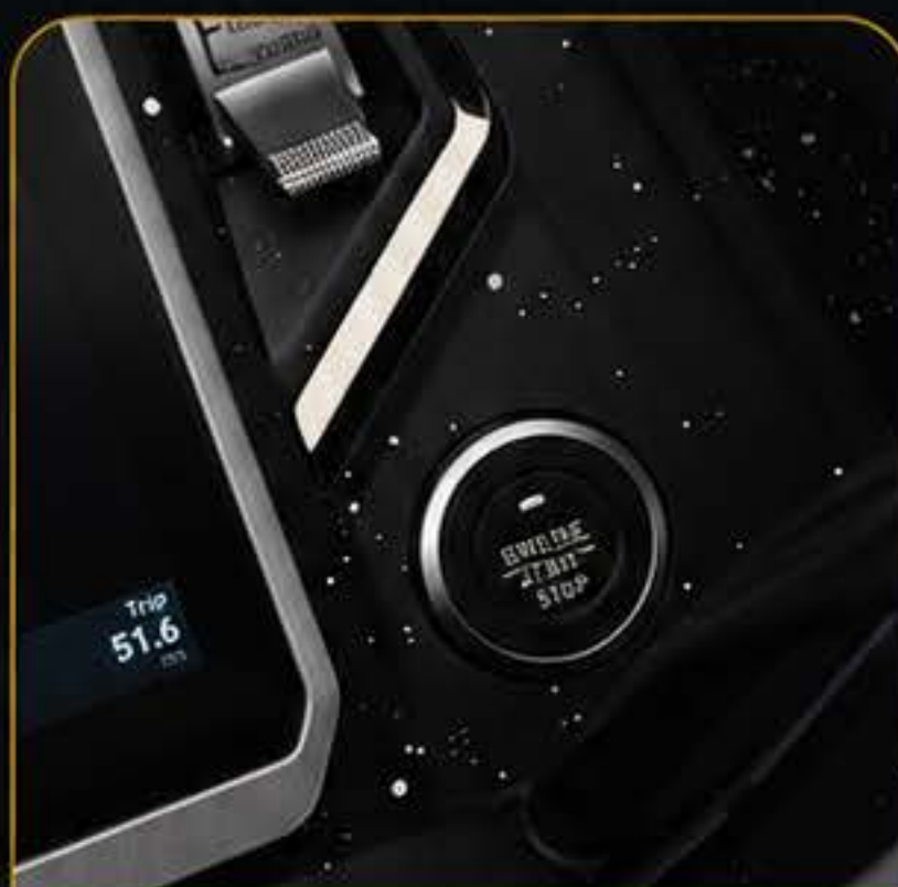
בורר מצבי רכיבה + התנעה